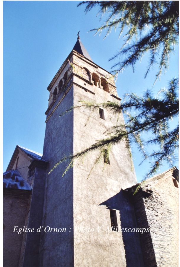
Eglise d'Ornon : Photo Y. Millescamps

Le patrimoine de la commune est riche et diversifié ; n'oublions pas que l'église d'Ornon, souvent reconstruite, existe depuis plus de mille ans ; pourquoi pas une campagne de fouilles ?