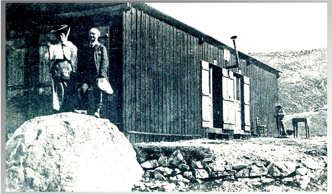
Refuge de l'Alpe de Villar d'Arène - 1909