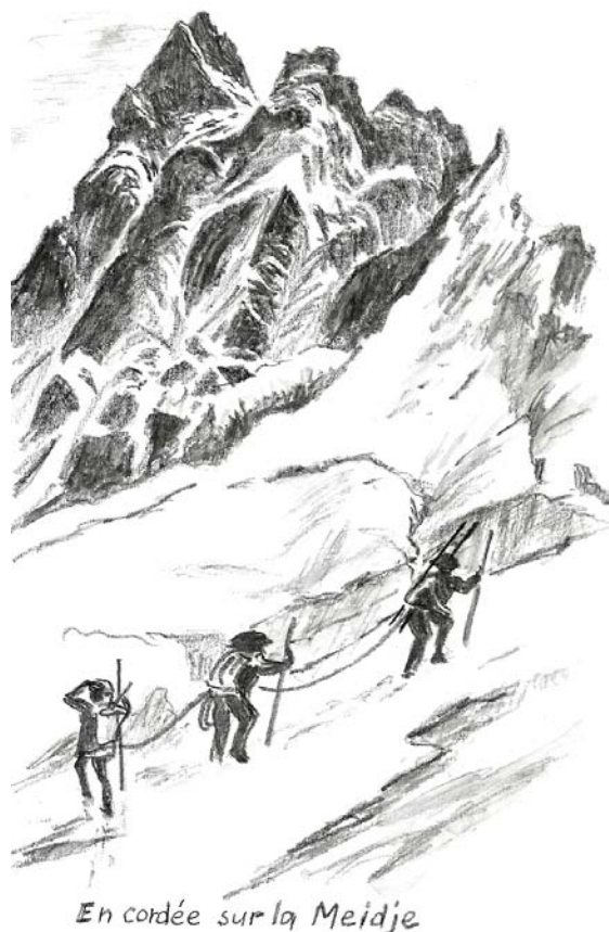
En cordée sur la Meidje

Ces soirées sont à nouveau organisées pour vous faire partager un peu la passion qui anime ces hommes et ces femmes depuis plus d'un siècle, ce feu sacré qui brûle dans les veines de ces alpinistes, skieurs de l'extrême, grimpeurs, free-riders, et qui leur fait accomplir des exploits. Et puis aussi notre prétention est de vous en mettre plein les yeux avec des prises de vue magnifiques dans un environnement minéral et hostile, avec des réalisateurs et des cameramen hors pair, donnant des films primés dans de nombreux festivals (Val d'Isère, Autrans, Les Diablerets ...)