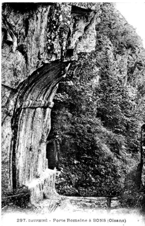
297. DAUPHINÉ - Porte Romaine à BONS (Oisans)