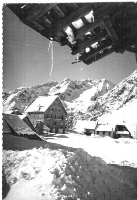
2 Alpes chalet U.N.C.M.