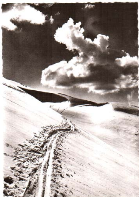
2 Alpes piste du diable