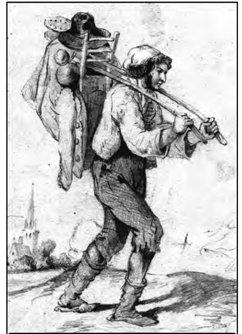
Colporteur – Dessin original du XIXe à la mine de plomb – Collection de l'auteur