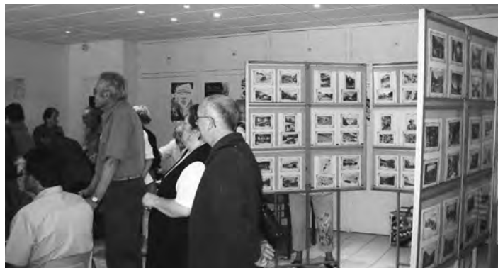
Une partie de l'assistance lors de la projection d'un diaporama

Le 10 Juillet dernier, par une belle journée estivale, dans la salle de la Mairie du Villar d'Arène a eu lieu notre seconde manifestation « Exposition de Cartes Postales de l'Oisans » de l'année. Quelque 200 Cartes Postales anciennes et semi modernes du Villar d'Arène, de la Grave, et des villages environnants ont été présentées au public ainsi qu'un diaporama sur cet Oisans des Hautes Alpes. Cette journée fut un franc succès car nous avons accueilli plus d'une centaine de visiteurs, sans compter les nombreux membres de notre association séjournant dans cet Haut Oisans, et qui nous ont fait l'honneur de leur visite. Merci à la Mairie de Villar d'Arène pour son sympathique accueil ainsi qu'aux collectionneurs de CP de notre association, qui une fois de plus ont répondu présent, en venant présenter leurs albums.