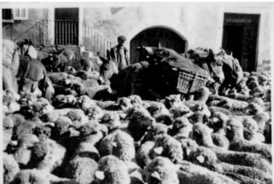
Arrivée du troupeau sur la place de Villar d'Arène.

La « cabane! » était une maison en pierres, elle était bien bâtie; elle avait été bâtie par la Mairie de Villar d'Arène. Elle était couverte en tôle. Elle était mieux que celle que nous avions